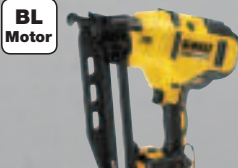
DCN 660 NT Nagler - 48 Joule Einschlagenergie - 1,4 x 1,6 mm Stauchkopfnägel 389,-* (462,91 inkl. MwSt.)