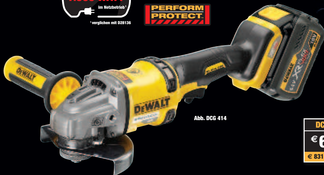
Abb. DCG 414