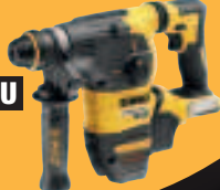
Abb. DCH 323 NT