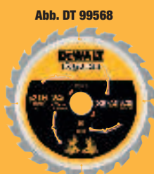
Abb. DT 99568