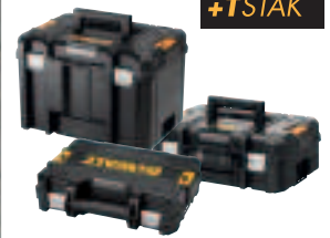
JEDE MASCHINE KOMMT IN EINER T STAK-SYSTEM-BOX