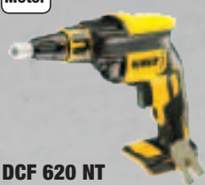
DCF 620 NT Schnellbohrschrauber - Leerlaufdrehzahl 0 – 4.400 min -1 209,-* (248,71 inkl. MwSt.)