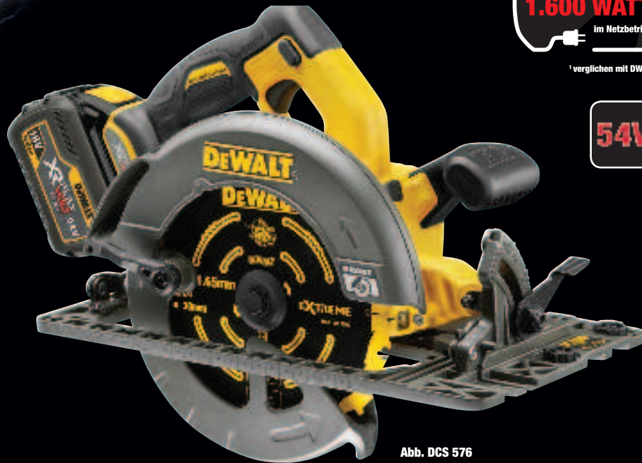
Abb. DCS 576

vergleichbar stark wie 1.600 WATT im Netzbetrieb 1