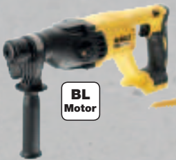
DCH 133 NT** NEU SDS-plus Kombihammer - 2,6 J Einzelschlagenergie - Max. Bohrdurchmesser (Beton): 26 mm 199,-* (236,81 inkl. MwSt.)