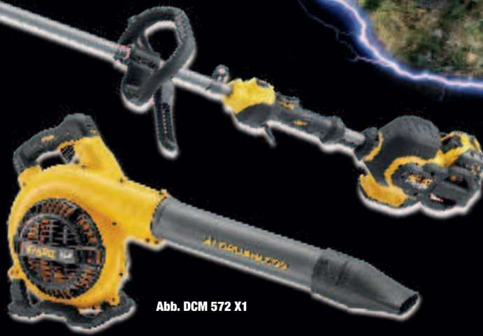
Abb. DCM 572 X1

DCM 571 X1 € 499,-* € 593,81 inkl. MwSt.