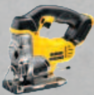
DCS 331 NT Pendelhub Stichsäge - Max. Schnitttiefe in Holz / Stahl 135 / 10 mm 209,-* (248,71 inkl. MwSt.)