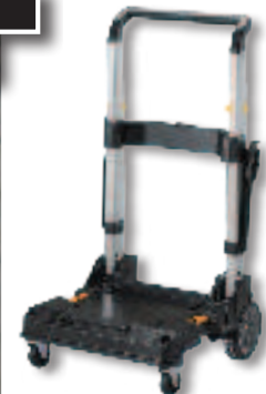
BEIM KAUF VON 5 NT-MASCHINEN* ERHALTEN SIE 1X +TSTAK TROLLEY

(Bestell-Nr.: TS TROLLEY / UVP: € 149,90*)