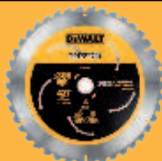
Abb. DT 99574