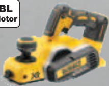
DCP 580 NT 82 mm Hobel - 2 mm max. Spanabnahme 179,-* (213,01 inkl. MwSt.)