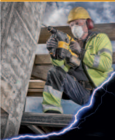
Abb. DCH 334