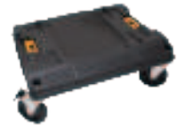
BEIM KAUF VON 3 NT-MASCHINEN* ERHALTEN SIE 1X +TSTAK CART