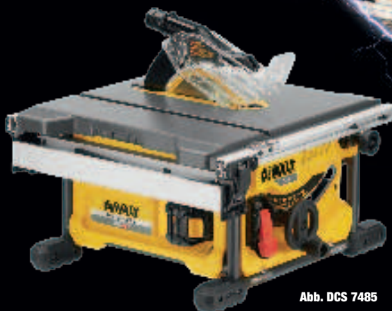
Abb. DCS 7485

vergleichbar stark wie 1.300 WATT im Netzbetrieb! * verglichen mit DW5520