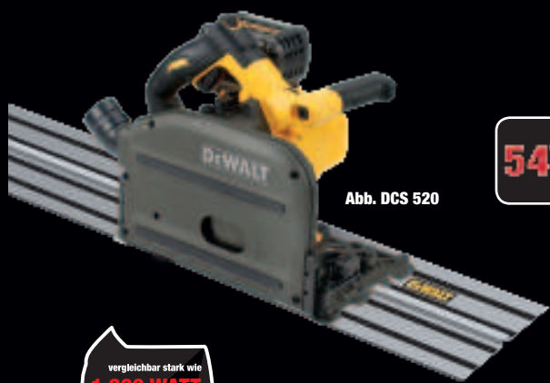
Abb. DCS 520

DCS 7485 N € 719,-* € 855,61 inkl. MwSt.