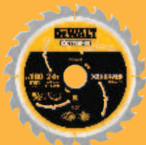
Abb. DT 99562