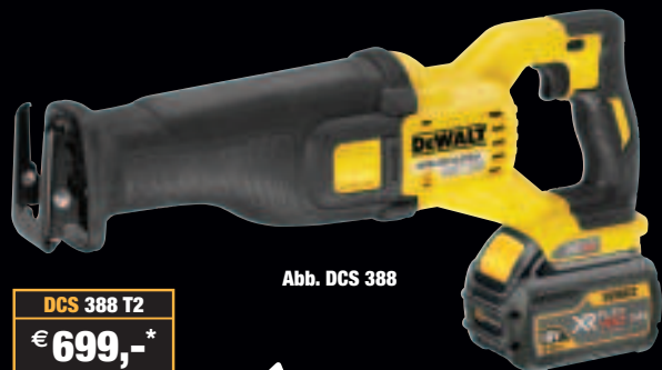
Abb. DCS 388

Erhältlich bei Ihrem Flexvolt-Partner. Bezugsquellen unter: http://www.dewalt-revolution.de