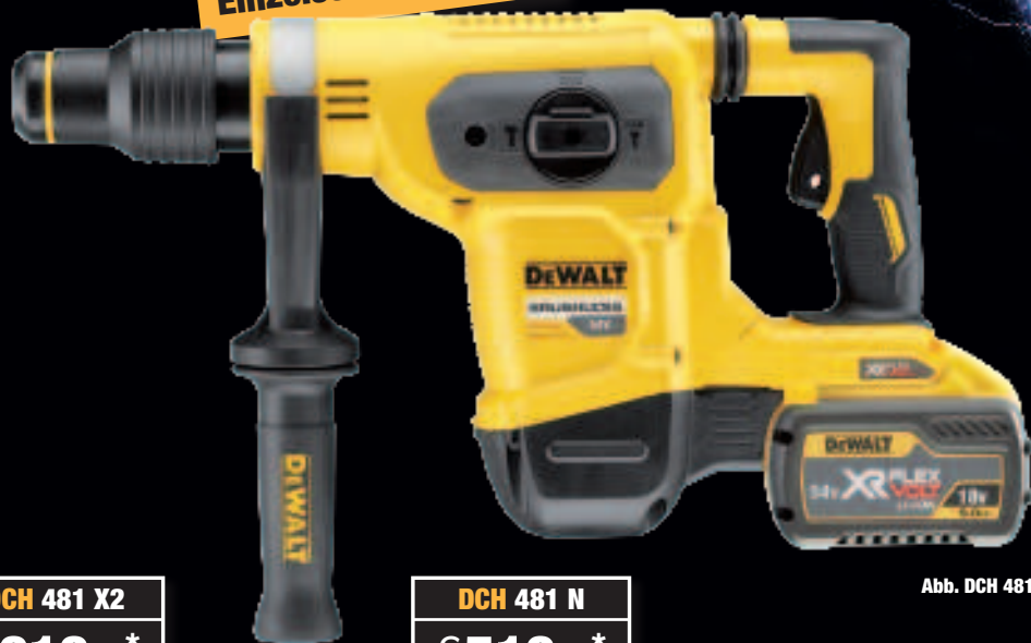
Abb. DCH 481