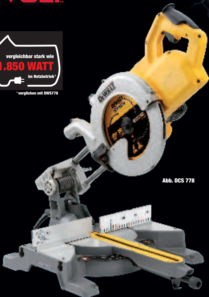
Abb. DCS 778

vergleichbar stark wie 1.850 WATT im Netzbetrieb 1 1 verglichen mit DWS778