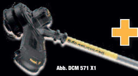
Abb. DCM 571 X1