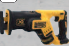
DCS 367 NT** NEU Säbelsäge - Leerlaufhubzahl: 0 - 2.900 min -1 209,-* (248,71 inkl. MwSt.)