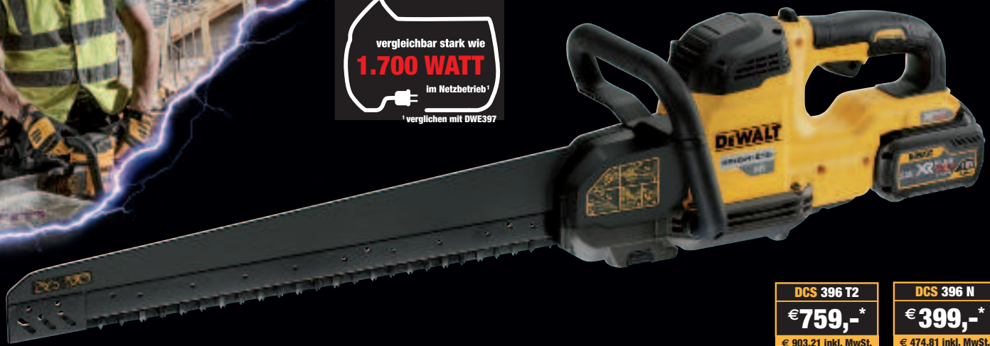
Abb. DCS 397

vergleichbar stark wie 1.700 WATT im Netzbetrieb! 1 verglichen mit DWE397