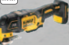
DCS 355 NT Multi-Tool - Oszillationen: 0- 20.000 min -1 199,-* (236,81 inkl. MwSt.)