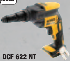
DCF 622 NT Universalschrauber - Leerlaufdrehzahl 0 – 2.000 min -1 209,-* (248,71 inkl. MwSt.)