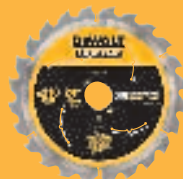
Abb. DT 99565